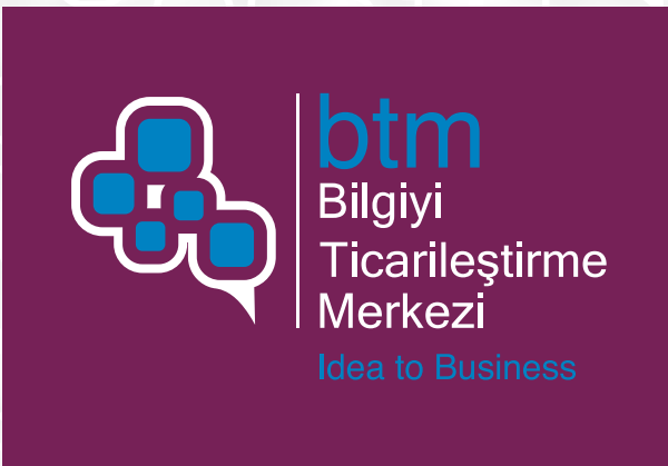
Pantone 7650 C renkli zemin üzerinde kullanım