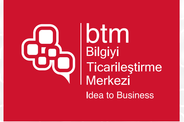
Pantone 186 C renkli zemin üzerinde kullanım