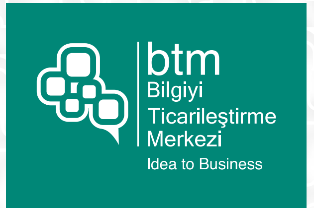
Pantone 327 C renkli zemin üzerinde kullanım