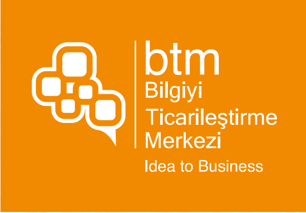
Pantone 144 C renkli zemin üzerinde kullanım