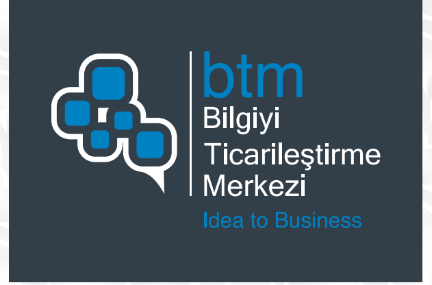
Pantone 432 C renkli zemin üzerinde kullanım