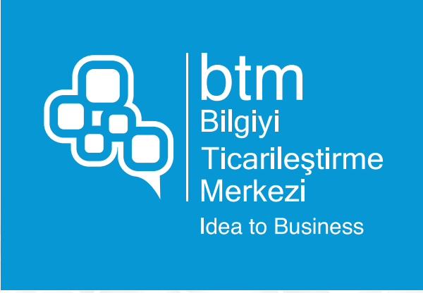
Pantone 299 C renkli zemin üzerinde kullanım